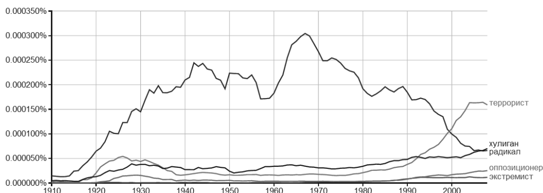
Рис. 2. Сравнительная употребляемость понятия «экстремист» в русскоязычных текстах за последние сто лет по данным сервиса Google Books Ngram Viewer

Graph these comma-separated phrases: case-insensitive between and from the corpus with smoothing of