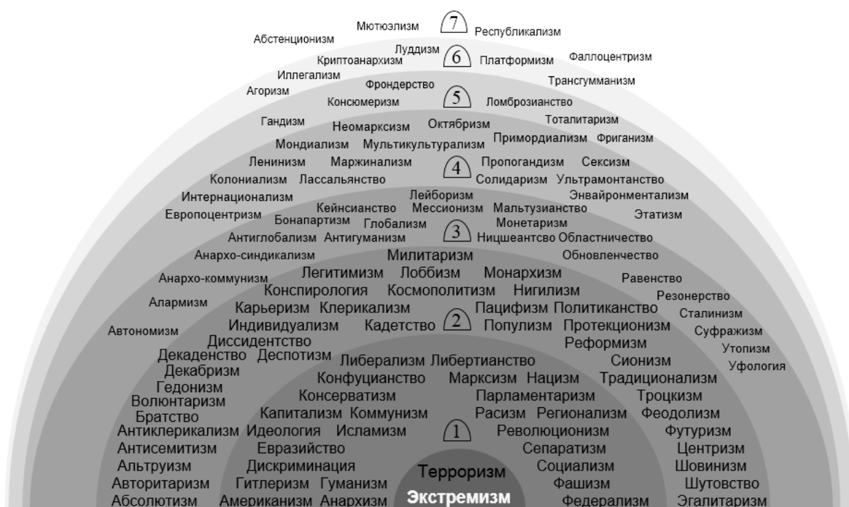
Рис. 3. Распределение в Рунете частоты связей различных идеологием с понятием «экстремизм»

Полученный срез информационного поля идеологием является вероятностным отображением, не дифференцированным по культурно-социальным стратам. Такая дифференциация не была бы релевантной для общедоступной информационной среды, так как любой текст на сайтах может быть прочитан любым пользователем. В такой ситуации уместна только частотная дифференциация вербальных полей. Результаты такой дифференциации позволяют установить, прежде всего, какие идеологии чаще, а какие реже связываются в общественном сознании с экстремизмом.