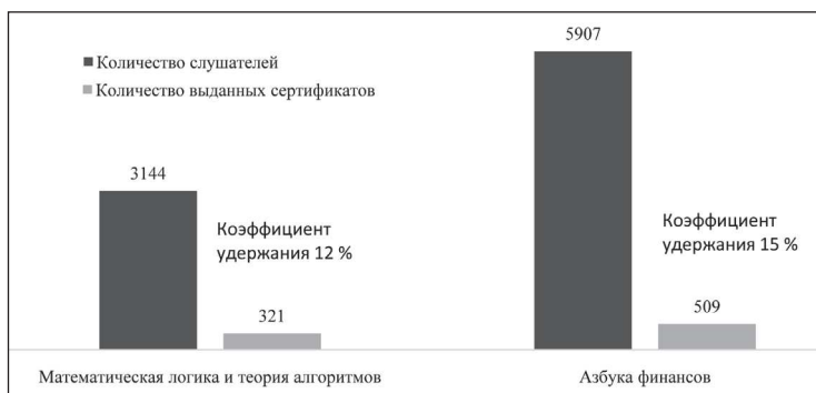
Рис. 3. Общая статистика МООК ТУСУРа