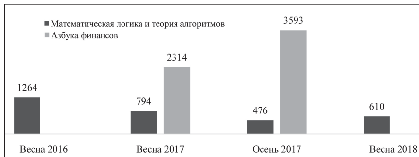
Рис. 4. Количество слушателей МООК ТУСУРа с разбивкой по запускам