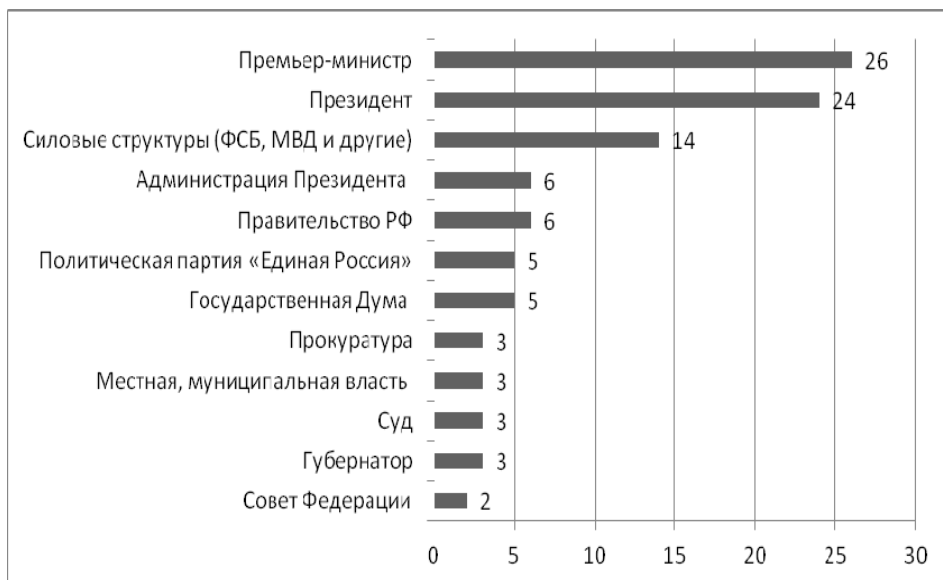
Диаграмма 2. «Кто, по Вашему мнению, обладает наибольшей властью в сегодняшней России?»

Особую роль респонденты признают за исполнительной властью; первые лица государства (тандем) оказывают наибольшее воздействие на политический процесс (президент Д.А. Медведев – 24% и премьер-министр В.В. Путин – 26%). Рокировка первых лиц государства, а также возросшая митинговая активность несущественно отразились на восприятии гражданами тандема.