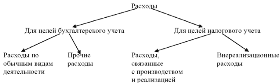
Рис. 1. Рассмотрение расходов с нормативно-правовой позиции

В соответствии с этим прибыль для целей налогообложения увеличивается на суммы затрат, превышающих установленные лимиты по перечисленным расходам (рис. 1).