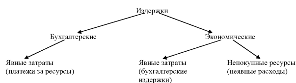
Рис. 2. Рассмотрение издержек с научной позиции

Затраты характеризуют в денежном выражении фактический объем ресурсов, использованных в определенных целях независимо от источника финансирования и имеющих отношение к данному отчетному периоду. По существу, затраты – это явные издержки предприятия, которые приводят в конечном итоге к получению экономических выгод, а расходы – это затраты, не приводящие к получению экономических выгод, но приводящие к уменьшению капитала организации (рис. 2).