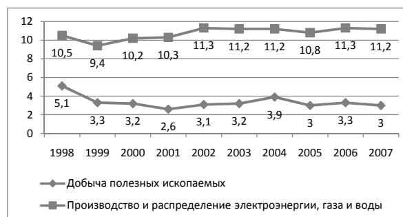
Рис. 2. Динамика численности занятых в ТЭК по видам экономической деятельности, тыс. чел.

Развитие энергетических мощностей Калининградской области оказывает влияние на рынок труда посредством привлечения на строящиеся предприятия ТЭК специалистов из других регионов. Так, при строительстве и начале эксплуатации введенной в 2006 г. Калининградской ТЭЦ-2 набор персонала осуществлялся путем привлечения специалистов из других регионов РФ и стран СНГ, так как в области отсутствовали специалисты необходимого уровня квалификации. 70% персонала ТЭЦ-2 – это мигранты, прибывшие из Москвы, Псковской, Смоленской, Ивановской, Астраханской областей, Беларуси, Казахстана. Данные мигранты обладают значительным трудовым потенциалом. Средний уровень их образования значительно выше, чем у местного населения. Так, 76%, приехавших работников имеют высшее, 24% – среднее специальное образование. Средний возраст специалистов составляет 36,5 года.