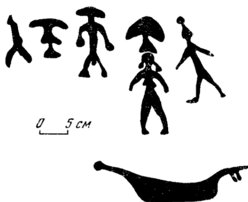
Рис. 2. Наскальный рисунок. Пегтымель, камень IX. I тыс. н.э.