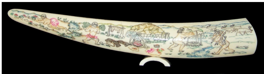
Рис. 5. Л. Теютина. Гравированный клык «В стойбище мухоморов». Уэлен, 2009 г.

мухоморов» и вступают с ними в контакты эротического характера (рис. 6). Подобное путешествие, вероятно, – результат поедания грибов. Это действие непосредственно не показано на гравюре, но о том, что оно имело место, красноречиво свидетельствует предыдущая сценка – соби́рание в тундре мухоморов.