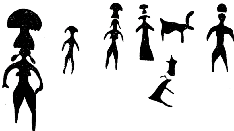
Рис. 4. Наскальный рисунок. Пегтымель, камень III. I тыс. н.э.