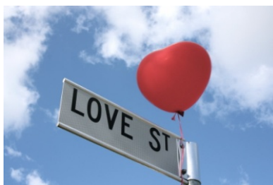
Рис. 3. Улица Любви в Ларен Каньон (Калифорния)

Некоторые имена женщин в текстах Моррисона позволяют соотнести их с Памелой, как, например, в этой песне («Maggie M'Gill», альбом «Morrison Hotel», 1970):