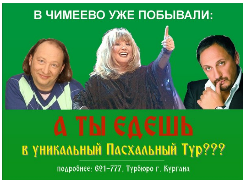
Рис. 2. Реклама тура в Чимеево. Запись на стене группы ВКонтакте от 25 авг 2015 г. ( https://vk.com/wall103612982_885 )

Гальцев вообще бывает очень часто, раза два в году непременно!» (Отзыв... Здесь живет чудо). Одна из турфирм г. Кургана разместила такой рекламный баннер: «В Чимеево уже побывали (и далее фотографии Ю. Гальцева, А. Пугачевой, С. Михайлова). А ты едешь в уникальный Пасхальный тур?» (Турбюро...). Конечно, аудитория поклонников этих персон велика и, видимо, турфирма рассчитывает, что по «следам» «звезд» эстрады проедутся и их поклонники (рис. 2).