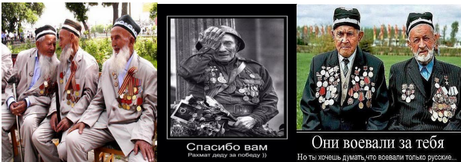
Рис. 7. Фотопосты и фотоколлажи ветеранов Великой Отечественной из стран Центральной Азии (жанр «Рахмат деду за Победу!»)

Важным национальным топиком является дискурс благодарности старикам – ветеранам Второй мировой войны из среднеазиатских государств, воевавшим на стороне Советского Союза. Как и в России, накануне Дня Победы «информационная стена» виртуальных этногрупп переполнена фото ветеранов из Средней Азии и словами благодарности в их адрес, нередко встречается слоган «Рахмат деду за Победу!», как и упреки русским в забвении вклада других этносов Советского Союза в победу в Великой Отечественной войне (рис.7).