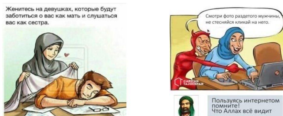
Рис. 3. Примеры комикс-постов с осуждением несправедного поведения девушек-мусульманок и позитивными образцами

Чрезвычайно обсуждаемая тема в группе «Дневник мусульманки © Ислам – поведение женщин согласно мусульманским правилам. Способы трансляции религиозных ограничений и запретов для мусульманских женщин многообразны: это и мусульманские пословицы («лучшая жена, которая разбудит мужа к Фаджру» (предрассветной исламской молитве), осуждение греховного общения между полами и флирта в социальных сетях и др. (рис. 3).