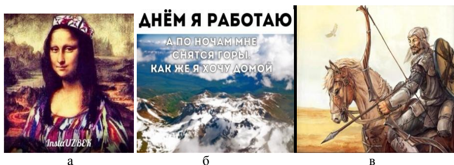
Рис. 5. Визуальные «маркеры» родины в постах и фотоколлажах виртуальных групп мигрантов а – образ Моны Лизы-узбечки; б – образ заснеженных вершин Таджикистана; в – образ легендарных воинов енисейских кыргызов

рошо, но если ты таджик то ты обязан знать свои народные инструменты!» [сохранена орфография оригинала]), в обеих этногруппах используется символика национальной одежды – халатов, тубетек; для кыргызских виртуальных комьюнити характерна публикация сцен соколиной охоты, борьбы, образов искусных степных наездников и пастбищ, легендарных батыров, относящихся к временам исторической славы енисейских кыргызов (рис. 5).