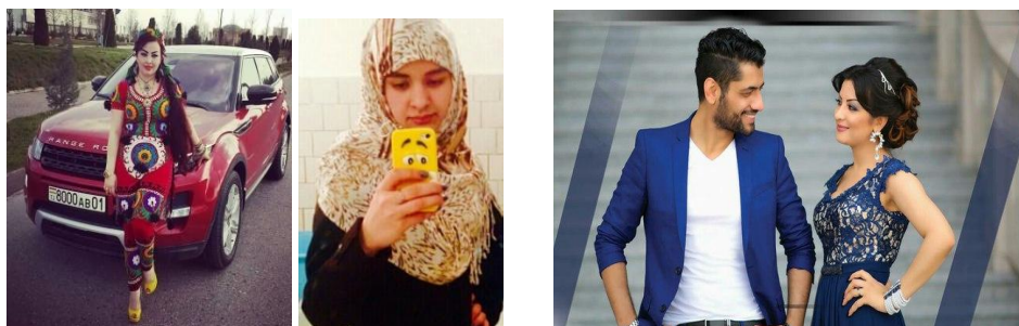
Рис. 10. Посты, отражающие влияние модных молодежных направлений и потребительских трендов в виртуальных этнокомьюнити мигрантов

4. Контентный дискурс эмансипации . В качестве маргинального контентного дискурса, пока ещё только набирающего силу, мы выделяем дискурс эмансипации, проявляющийся достаточно фрагментарно и несмело в сравнении с другими господствующими этнодискурсами. Тенденция на антитрадиционалистскую и антирелигиозную эмансипацию проявляется в принятии и использовании глобальных потребительских трендов и молодежных западных направлений (в частности, селфи; группы «Selfie Tj | Селфи Таджикистан →» ( http://vk.com/selfie_tjk ), «Селфи Кыргызы→» ( http://vk.com/selfie_kgz ), использовании в названиях групп эпитетов «гламурные» (группа «ЎЎСаМыЕ ЧЧёТКиЕё ГлАмуРные УзБеКи» ( http://vk.com/public53859175 ), «золотая молодежь» (группа «Золотая молодежь Таджикистана...» 2012 ) ( http://vk.com/elected_tj ) (рис. 10).