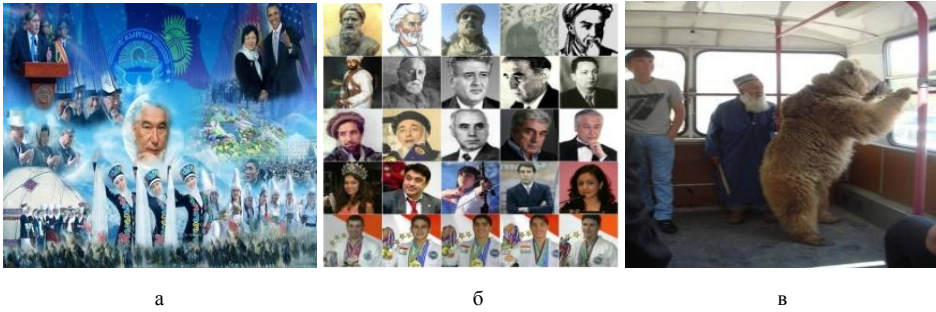
Рис. 6. Фотопосты и фотоколлажи великих людей нации в виртуальных группах мигрантов а – образы великих кыргызов; б – образы великих таджиков; в – фотопост знаменитой ручной душанбинской медведицы с дрессировщиком-дедушкой

Важным национальным топиком является дискурс благодарности старикам – ветеранам Второй мировой войны из среднеазиатских государств, воевавшим на стороне Советского Союза. Как и в России, накануне Дня Победы «информационная стена» виртуальных этногрупп переполнена фото ветеранов из Средней Азии и словами благодарности в их адрес, нередко встречается слоган «Рахмат деду за Победу!», как и упреки русским в забвении вклада других этносов Советского Союза в победу в Великой Отечественной войне (рис.7).