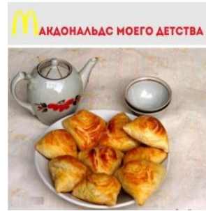
Рис. 8. Посты-коллажи с осуждением потребительского общества в виртуальных группах центральноазиатских мигрантов

Важным элементом традиционалистского нравственного дискурса является призыв к почитанию старших, особенно родителей, он принимает чрезвычайно разнообразные формы (рис. 9) от приведения цитат из Корана («Довольство Аллаха – в довольстве родителей, и гнев Аллаха – в гневе родителей...»), народных пословиц («Таджикская поговорка: Отец не может прославить сына, но сын может прославить отца») до поэтических сентенций и убеждающих риторических нарративов.