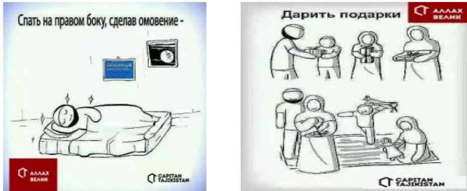
Рис. 4. Примеры комикс-постов о правильном поведении мусульманина

Множество исламских постов посвящены теме правильного поведения мусульманина. Истинно мусульманское поведение описывается порой в формате доходчивой манеры комиксов, взятых как развлекательный формат у «разлагающегося» Запада (рис. 4).