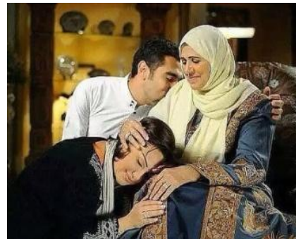
Рис. 9. Посты, посвященные почитанию родителей в виртуальных группах центральноазиатских мигрантов

Мы несколько раз встречали в разных интерпретациях в виртуальных этногруппах популярную апокрифическую историю старика-отца, который обращается в мастерскую с поломкой сотового телефона, а узнав, что он цел, сокрушается, почему же ему не звонят его дети.