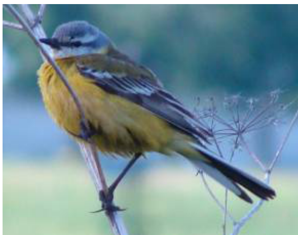
Рис. 1. Взрослый самец Motacilla flava beeta. 22.06.2009, аэропорт «Кемерово». [Fig. 1. Adult male Motacilla flava beeta, 22.06.2009, Kemerovo airport. ]

22 июня 2009 г. в аэропорту «Кемерово» сфотографирована жёлтая трясогузка, подходящая под описание формы beeta (рис. 1).