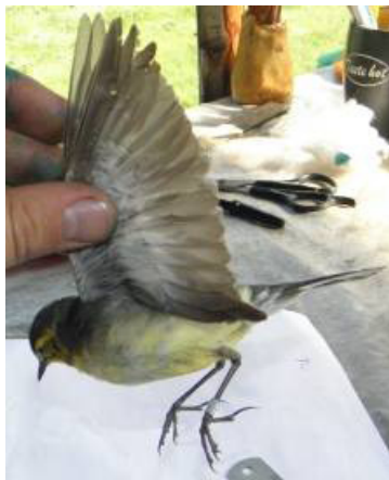
Рис. 5. Взрослая самка Motacilla (citreola) werae werae. 25.05.2011, биостанция «Ажандарово». [Fig. 5. Adult female Motacilla (citreola) werae werae 25.05.2011, Azhendarovo Biological Station. ]

обеих форм. До середины июля, т.е. начала периода осенних миграций, среди отловленных взрослых трясогузок на основании соотношения длины крыла и цевки можно выделить две особи (отловленные 25.05 и 12.07) с размерными характеристиками, свойственными малой желтоголовой трясогузке, и две особи (отловленные 02.06) – для желтоголовой трясогузки (рис. 5, 6).