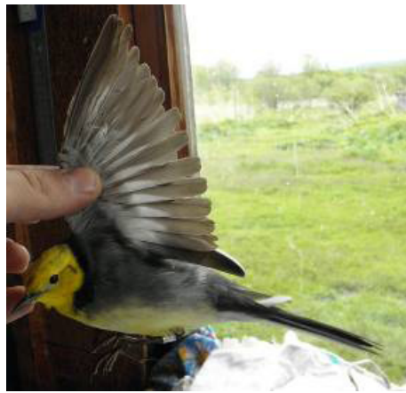
Рис. 6. Взрослый самец Motacilla citreola citreola. 02.06.2014, биостанция «Ажандарово». [Fig. 6. Adult male Motacilla citreola citreola 06.02.2014, Azhendarovo Biological Station. ]

В послегнездовое время пролёт M. citreola sensu lato наблюдается во второй декаде июля – второй декаде августа. На основании морфологической дифференциации видов (табл. 2, 3) нами была предпринята попытка частично «реконструировать» видовую принадлежность особей M. citreola sensu lato, отловленных и окольцованных в прежние годы. На основании этого можно заключить, что примерный период послелиночной миграции M. citreola приходится на август – начало сентября, а пролёт M. werae – на конец июля – первую половину августа. Стоит отметить, что если в долине средней (биостанция «Ажандарово») и нижней (г. Томск) Томи присутствие M. citreola зафиксировано единично, то в пойме среднего течения р. Обь (стационар «Манатка») в 55 км ниже устья Томи доля M. citreola в отловах мая–июня определяется на уровне 58% ( n = 12 ).