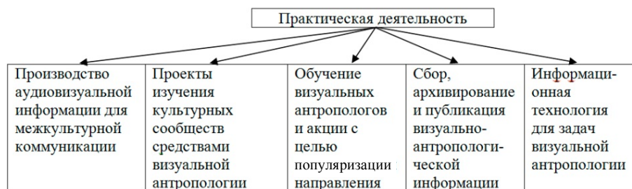
Рис. 1. Практическая деятельность визуальной антропологии

Присоединяясь к такому пониманию предназначения визуальной антропологии и стремясь определить ее место в окружении соседних дисциплин, в качестве отправной точки для дальнейшего рассмотрения мне бы хотелось предложить свою формулировку 4 . Итак, визуальная антропология – это комплексная (практическая и теоретическая) деятельность с целью исследования и репрезентации аудиовизуальными средствами характерных черт социокультурных сообществ на определенных этапах их существования 5 .