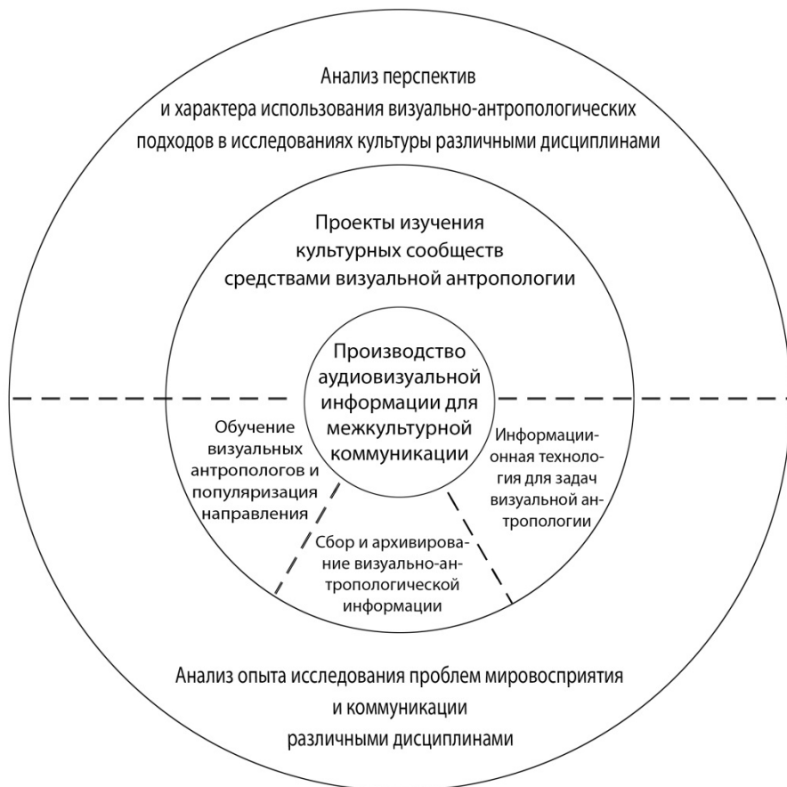
Рис. 3. Центростремительная направленность исследований визуальной антропологии

деятельности», в котором проявляются закономерности, служащие предметом исследований собственно визуальной антропологии (рис. 3).