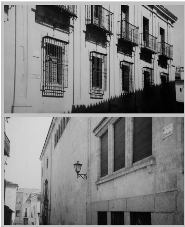
Улица Тостадо в Саламанке.

Попав в XVIII в. в число избранных, по признанию Испании эпохи Просвещения, образ Алонсо Мадригала зримо присутствует в серии портретов выдающихся испанцев, которая, в свою очередь, может иметь варианты судьбы, по числу равные тиражу ее издания. Один из этих вариантов нам доподлинно известен – примерно век бытования в одной из крупнейших родовых библиотек русской аристократии и уже более века – в библиотеке старейшего сибирского университета.