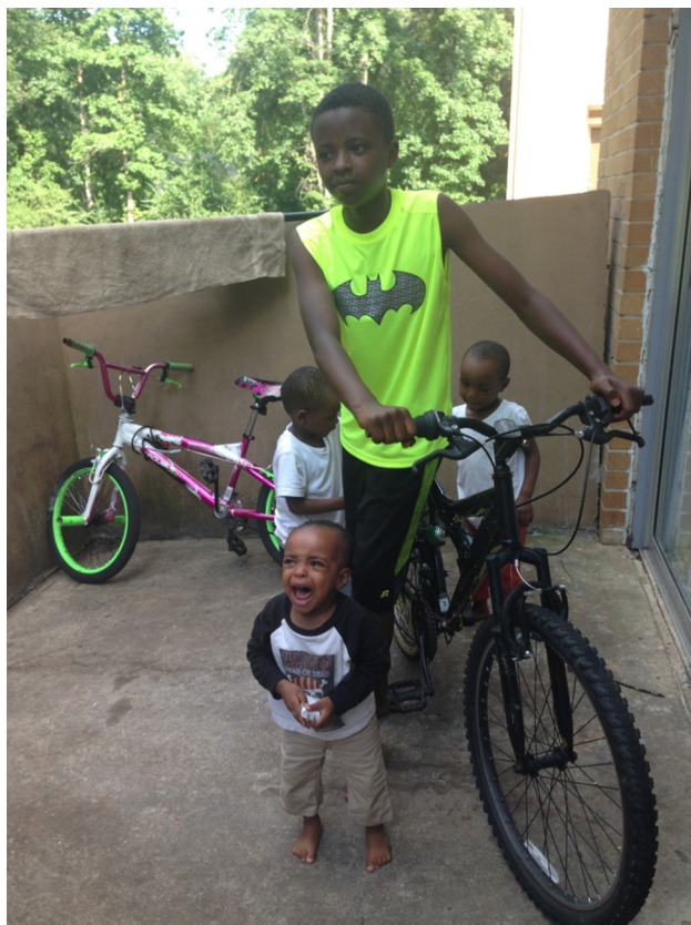
Фото 1. Дети из семьи беженцев из Руанды, недавно приехавшей в Кларкстон. 2017 г.

орган. От государства же беженцы получают пособие в течение 90 дней после въезда в страну, включающее чек на аренду жилья на это время, приобретение предметов первой необходимости и небольшую сумму денег на остальные нужды. Непосредственными делами, связанными с размещением и жизнеобеспечением беженцев, занимаются, как правило, неправительственные организации, с которыми государство заключает специальные контракты. Это могут быть как светские, так и религиозные НГО. На их же помощь беженцы могут рассчитывать по истечении первых 90 дней пребывания в США, когда они больше не получают государственной материальной поддержки (фото 1).