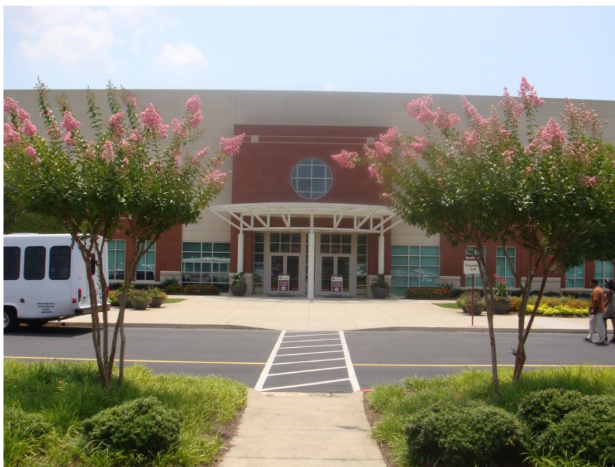
Фото 13. Церковь сообщества Норт Пойнт. 2011 г.

Еще одна характерная особенность мегацеркви – это ее устройство по принципу торгово-развлекательного комплекса. Современный мегацерковный комплекс включает огромные залы для богослужений со сценой, партером, амфитеатром, балконом, в церкви обычно есть кафе, магазины церковной литературы, библиотеки, специально оборудованные помещения для детей, различные службы быта и т.п. Мегацерковь – это церковь для занятых не очень религиозных горожан, привыкших ценить свое время и комфорт. Она стремится быть им понятной и привлекательной.