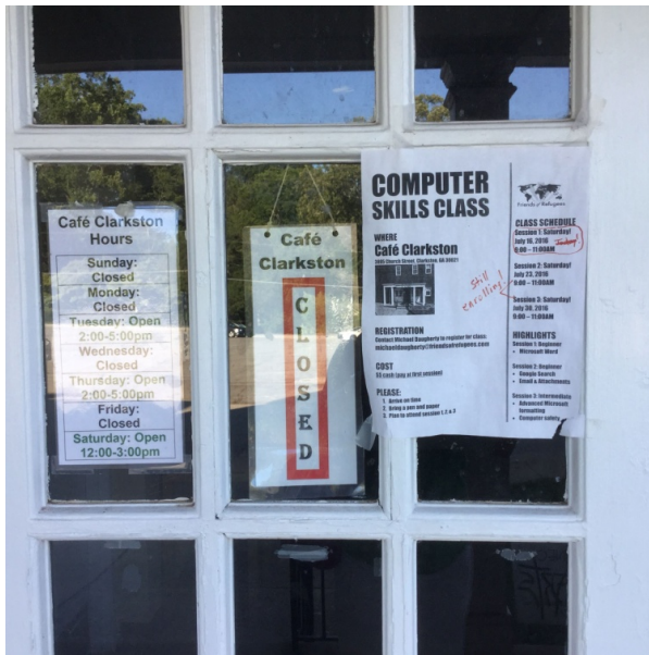
Фото 3, 4. Программы, предлагаемые организацией «Friends of Refugees». 2016 г.