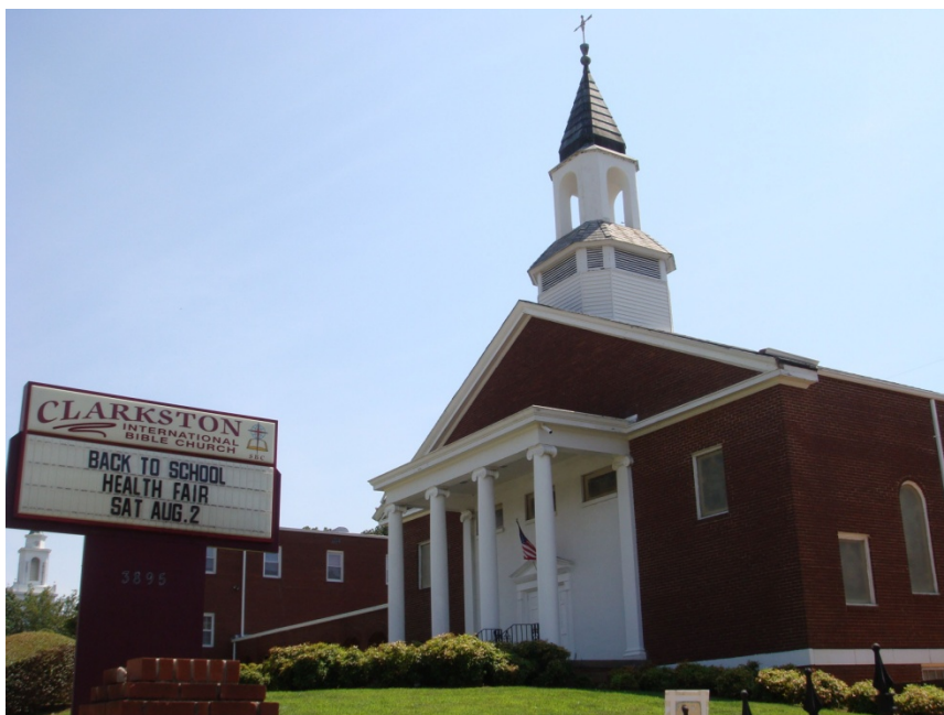
Фото 6. Кларкстонская международная библейская церковь. 2014 г.

Основное богослужение в церкви – в воскресенье утром. В настоящее время на него обычно приходят человек 150: примерно 50 составляют старожилы – белые кларкстонцы, половина из которых старики, приблизительно 50 – филиппинцы и еще 50 – беженцы-христиане, в основном из Африки. Примечательно, что сидят не вперемешку, а именно этими группами (ПМА 5, наблюдение в церкви). Воскресное утро – самое сегрегированное время в Америке!