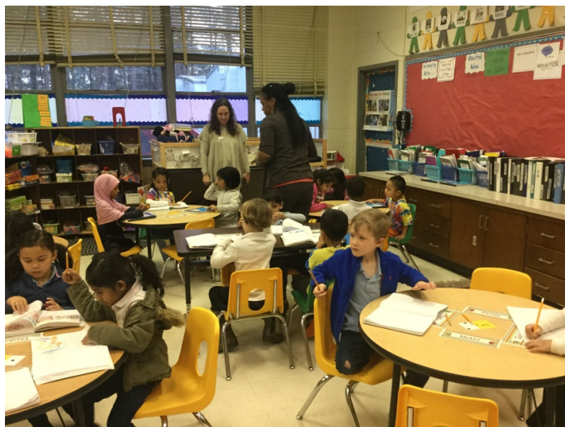
Фото 11, 12. Школа международного сообщества. 2015 г.