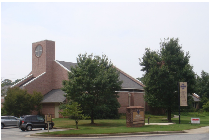
Фото 10. Церковь городского сообщества. 2015 г.

Церковь городского сообщества [Intown Community Church] (фото 10) – одна из конгрегаций Пресвитерианской церкви в Америке, находится в благополучном и престижном районе Атланты недалеко от Университета Эмори. Беженцы здесь не живут. Часть прихожан церкви, среди которых есть преподаватели и сотрудники Университета Эмори, живут поблизости от церкви, другие же приезжают из более отдаленных районов города, их привлекают теологические и социальные позиции церкви.