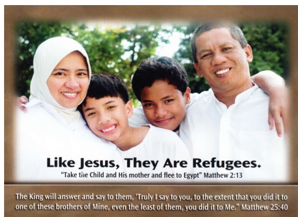
Фото 5. Листовка в церкви. 2017 г.

Организация «Friends of Refugees», как и другие подобные организации, имеет небольшой штат оплачиваемых работников и большую группу волонтеров: это типично для религиозных НГО. На одном собрании Кларкстонской районной ассоциации церковного служения [Clarkston Area Ministries Association] выступавший подчеркнул, что миссионерство, волонтерство, благотворительность, социальная работа – это Божественное призвание [calling] (ПМА 5, член Кларкстонской районной ассоциации церковного служения). Другой аргумент: если государство дает так мало, церковь должна дать остальное, поскольку в этом и состоит Божественный план, по которому верующие должны помогать беженцам как наименее защищенным (ПМА 6, прихожане церкви городского сообщества). Об идее призвания и Божественного плана я не раз слышала и от непосредственных участников социальных программ. Другая мотивационная составляющая заключается в том, что социальное служение – это служение Богу и любовь к Богу. Так, директор офиса «World Relief Atlanta», выступая на семинаре в пресвитерианской церкви и приглашая прихожан к участию в программах помощи беженцам, привел в пример собственный опыт. Он сказал: «Я служу беженцам не потому, что я люблю беженцев (хотя я люблю беженцев), а потому, что это лучший способ послужить Богу».