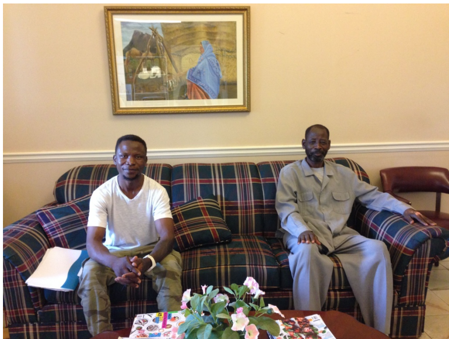
Фото 2. В офисе «World Relief Atlanta». 2016 г.

имеет небольшой штат постоянных сотрудников и очень разветвленную сеть волонтеров, интернов и временных оплачиваемых работников, получающих очень скромное (иногда символическое) вознаграждение.