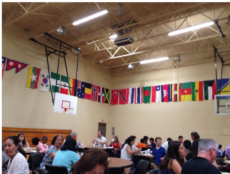
Фото 8. Воскресный обед в Кларкстонской международной библейской церкви. 2016 г.

С марта 2016 г. в Кларкстонской международной библейской церкви служит пастор Трент Делоач, сменивший на этом посту пастора Фила Китчина, вышедшего на пенсию, но по-прежнему помогающего церкви. В воскресенье утром основная конгрегация проводит службу в главном богослужебном зале, а отдельные этнические общины – в малом богослужебном зале (основная конгрегация использует этот зал в среду вечером для молитвенного собрания), спортивном зале и кафетерии. Другие этнические общины по очереди, в соответствии с расписанием, проводят свои богослужения в главном зале по окончании богослужения основной конгрегации. В воскресный полдень после богослужения основной конгрегации в просторном спортивном зале церкви устраивается общий обед по системе шведского стола для всех общин за символическую плату в 3 доллара на человека, но не больше чем 12 долларов за семью, что особенно выгодно большим семьям беженцев (фото 8).