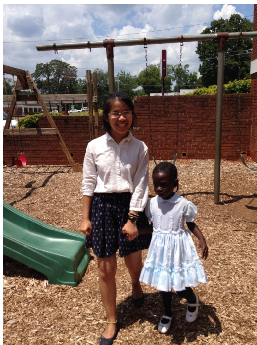
Фото 9. Китайская студентка-волонтер с девочкой из Южного Судана. 2016 г.

Церковь откликается на конкретные нужды семей беженцев, например организует сбор школьных принадлежностей для кларкстонских детей перед началом учебного года. На одном из летних воскресных богослужений 2016 г. пастор представил конгрегации приглашенных церковью студентов-интернов, которые во время летних каникул безвозмездно работали в Кларкстоне с детьми беженцев, стремясь организовать и улучшить их досуг. Среди самих интернов тоже были иностранцы, в частности студентка из Китая, обучающаяся в Атланте. После богослужения я встретила ее на детской площадке, где она играла с девочками из Южного Судана (фото 9).