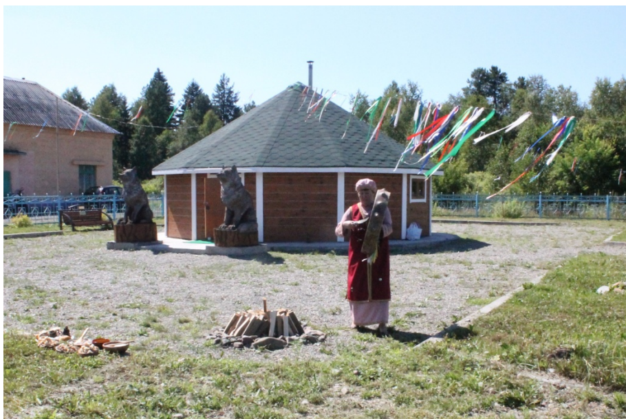
Рис. 4. Фрагмент подготовки к освящению центра шорской культуры. Дер. Чувашка, 19.07.2014 г.

Однако, помимо этих инициатив, направленных на общую стабилизацию ситуации, переживаемая травма обуславливает также реальный рост интереса населения к сакральным практикам, в том числе и к культуре шаманизма. По нашим наблюдениям во время полевых исследований 2013 г., казалось, что в обращении к шаманизму многие люди ищут не столько «защиту» для уже, безусловно, потерянного на тот момент пос. Казас, сколько душевное спокойствие и силы, необходимые для сохранения оставшихся шорских деревень и в первую очередь пос. Чувашка, последнего «оплота» шорской культуры в низовьях р. Мрассу. В настоящее же время, с учетом уже завершенных стадий конфликта и начала периода восстановительных практик, ревитализация шаманизма у шорцев Чувашенской территории видится несколько в ином ключе. Дело, конечно, не только в «душевном спокойствии». «Возрожденный» шаманизм в контексте исследуемой ситуации, скорее всего, необходим именно для переживания местным сообществом нанесенной им травмы через сакрализацию нарушенного угольными компаниями природного пространства. Наделенные сакральными свойствами природные объекты, такие, к примеру, как священная гора Карагайляш (к настоящему времени полностью уничтоженная), как, собственно, и сам ликвидированный Казас, продолжают не только суще-