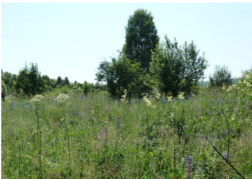
Рис. 2. Вид на кладбище дер. Казас. 15.07.2013 г.

предками. Проявляется оно в основном в рассказах о некогда живших выдающихся казасинцах, родителях и более далеких предках наших информантов. Таких рассказов, действительно, много, что позволяет предположить, что эта тема была актуализирована именно дискурсивным переживанием травмы, связанной с утратой людьми освоенного, привычного и эмоционально ценного жизненного пространства.