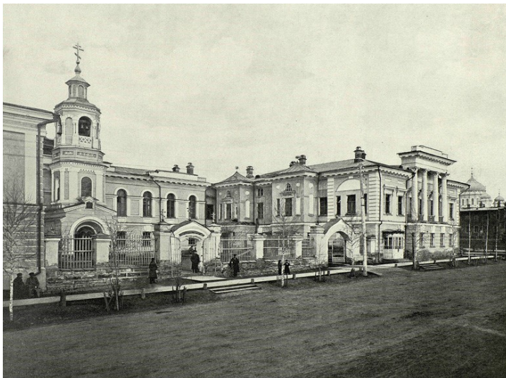
Рис. 4. Архиерейская домовая церковь в Томске Hierarchal house church in Tomsk