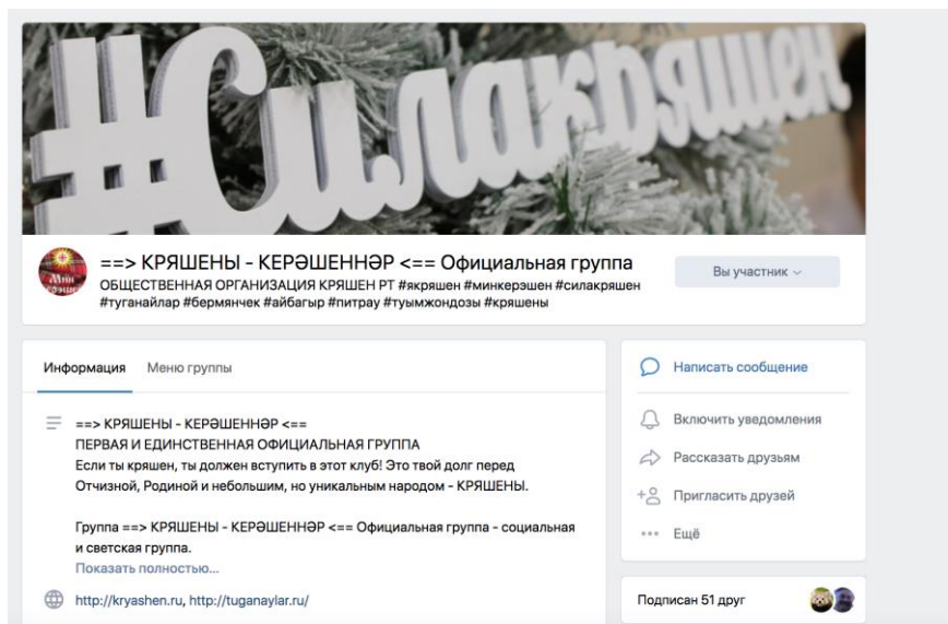
Рис. 1. Интерфейс группы ВК ==> КРЯШЕНЫ - КЕРӘШЕННӨР <== Официальная группа