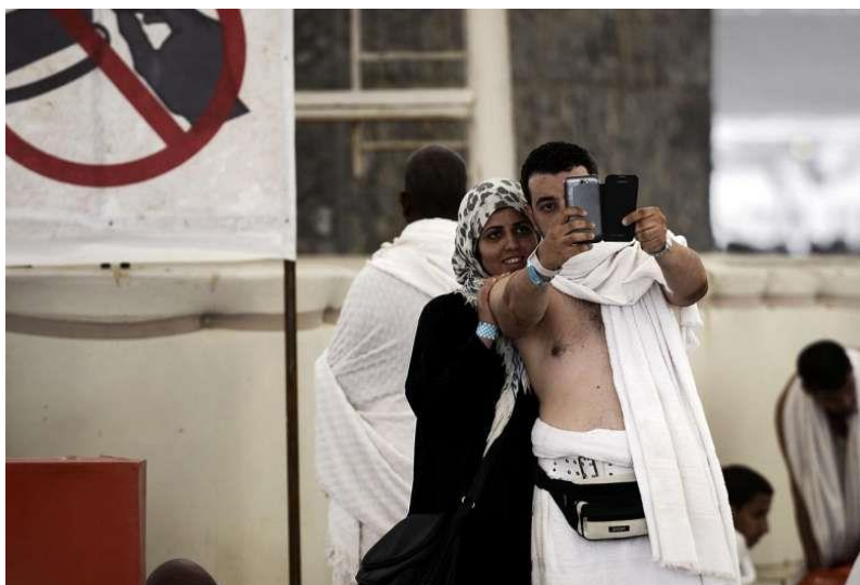
Рис. 3. Селфи набирают популярность в хадже.

Массовое выкладывание в Сеть фотографий на фоне святых мест мусульманскими интернет-пользователями достигает своего апогея в период хаджа – в двенадцатый месяц лунного календаря зул-хиджа, когда более двух миллионов паломников из 180 стран встречаются в Саудовской Аравии (Актуальные вопросы 2004). Это самое большое ежегодное ритуальное собрание в мире. Паломники находятся в святых городах области Хиджаз Королевства Саудовская Аравия от 10 до 30 дней, на протяжении которых многие из них онлайн активны. В список товаров, запрещенных к ввозу в Мекку, входят «камеры, позволяющие видеть оголенным тело одетого человека»; видеотелефон и даже электронный «михраб» (направление Каабы в Мекке) (Актуальные вопросы 2004). Тем не менее смартфоны не запрещаются для использования в святых местах.