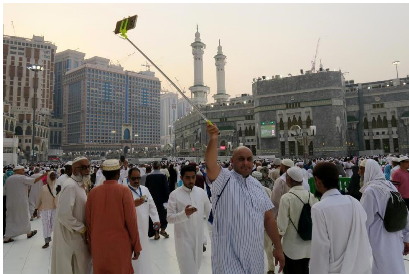
Рис. 2. Путешествие в Мекку.