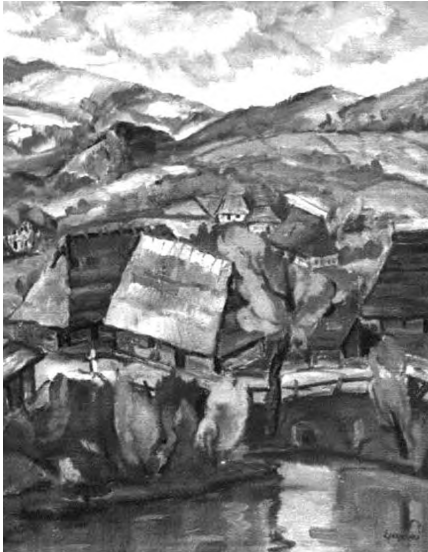
Картина 4. А. Ерделі. Село коло річки.

з великою майстерністю передає буяння природи Карпат: ліси, гори, квіти і гірські потоки. Особливо вражають витонченістю цілий ряд його робіт з польовими травами. Буяння життя нестримно присутнє в цих роботах. Художник тут проявився як тонкий живописець.