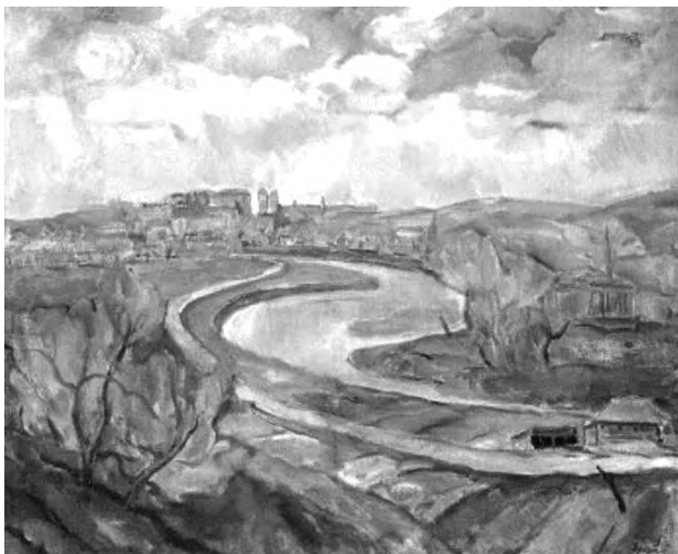
Картина 3. А. Ерделі. Околиці міста Ужгорода.

Адальберт Ерделі проявив себе як колорист, майстер пейзажного та портретного живопису, натюрморту. Завдяки сміливості, динаміці та незвичності колірних композицій він створив неповторні твори, більшість із яких зайняли почесне місце в експозиціях музеїв України та зарубіжжя (картини 3, 4) [7: 111].