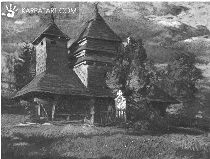
Картина 2. Й. Бокшай. Ужоцька церква.