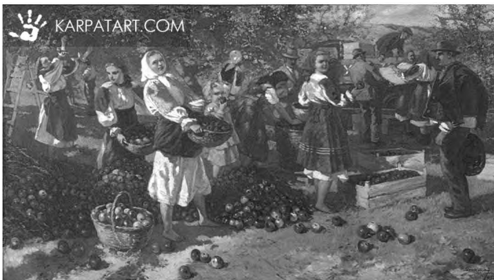
Картина 1. Й. Бокшай. Збір яблук.

є колорит національного вбрання на тлі характерного пейзажу. Він не зосереджується на етнографічній описовості, а намагається створити узагальнений образ-картину засобом колористичних комбінацій площини та вібрації барв... Значного обсягу втілення народних типажів, а також атрибутів національного костюму гуцулів та верховинців простежується й в сакральному живописі (картини 1, 2) [5].