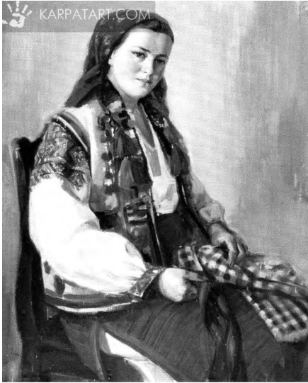
Картина 6. А. Коцка. Жіночий портрет.

«Маски», «Зустріч молодих», «Вбирають молоду», «Мати з дитиною у полі», «Діти на вербі» та ін. Ці полотна мають велике значення у формуванні в уяві багатьох українців та місцевих жителів знань про традиції та побут Закарпаття.