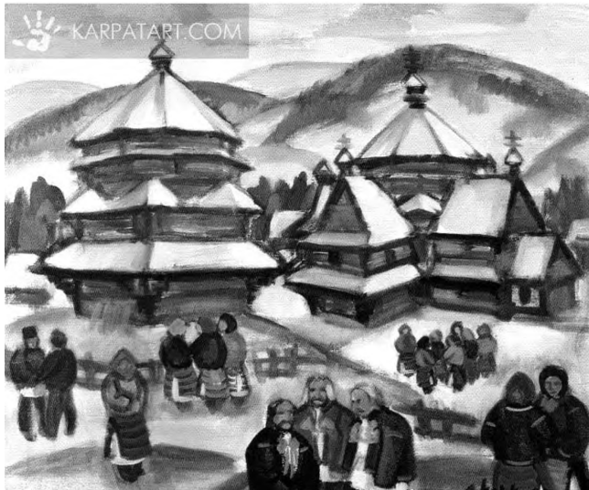
Картина З. А. Коцка. За звичаєм.

окремих художників, які діяли у міжвоєнний період на Закарпатті, можна з упевненістю сказати, що, незважаючи на складні умови, талант і мистецтво русинського краю розвивався і множився. Саме цей період характеризується прагненням до самоорганізації місцевих художніх сил і творчого взаємообміну. Русинські художники творили мистецтво, яке могло уповні виразити багате життя мешканців Карпат, незрівнянний ландшафт та його барви. Це допомогло розвинути професійні навички художникам краю та створити надзвичайно потужну закарпатську мистецьку школу.