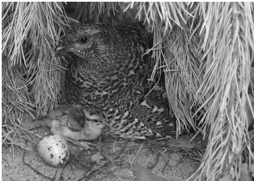
Рис. 2. Дикуща с птенцом в вольере

Здесь создано экспериментальное хозяйство Новосибирского зоопарка и сформировано маточное поголовье дикуши. Сложность его создания была связана с разработкой способов содержания, кормления и размножения дикуш в вольерных условиях, тем более что в научной среде сложилось устойчивое мнение о нецелесообразности разведения этого вида из-за того, что все ранее предпринимавшие попытки содержания птиц в неволе оканчивались их скорой гибелью. Проведённые исследования, начатые более 20 лет назад, позволили снять многие барьеры на пути создания вольерной популяции дикуши. Первых птенцов от дикуш, отловленных в природе, мы начали получать и выращивать в 1989–1990 гг. [4. С. 265–266; 5. С. 105–109]. Все дикуши в питомнике, в том числе предназначенные к выпуску, окольцованы алюминиевыми кольцами серии DV, ведётся племенная книга.