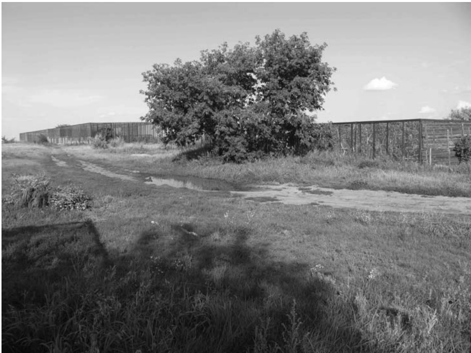
Рис. 1. Вольерный комплекс Карасукского стационара

В связи с этим на ученых, природоохранные учреждения и общественность ложится вся ответственность за сохранение и восстановление численности этого уникального вида. Проблема необходимости создания охраняемых территорий в местах обитания дикуши, снижения пресса охоты и техногенного воздействия на этот вид многократно поднималась в научной литературе и прессе. Авторы статьи считают, что одним из рукотворных направлений сохранения этих птиц должно быть разведение их в питомниках и последующее увеличение численности в природе за счет особей, выращенных в вольерах. На успешность выпуска в природу вольерных птиц указывает положительный опыт восстановления численности исчезнувших в природе сапсана и калифорнийского кондора в США [3. С. 10–11]. Ясно, что в пределах ареала выпуски дикуш вольерного разведения можно организовывать лишь на охраняемых территориях. На наш взгляд, перспективным является создание новой резервной популяции на территории вне естественного ареала с подходящими для вида базовыми параметрами (климатическими, кормовыми, гнездовыми и др.). С этой целью в Новосибирской области, в плане межведомственного сотрудничества Института систематики и экологии животных (ИСиЭЖ) СО РАН и Новосибирского зоопарка, мы проводим исследования по изучению и разведению дикуши и других видов в питомнике Карасукского стационара ИСиЭЖ СО РАН (рис. 1, 2).