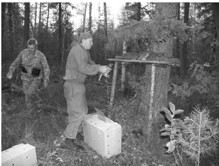
Рис. 4. Выпуск дикуш на подкормочные площадки