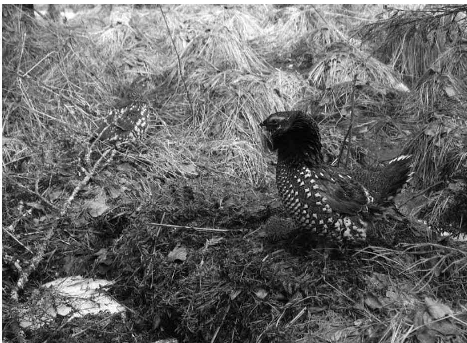
Рис. 5. Ток дикуши после выпуска

На ночлег птицы устраивались на ветки стоящих рядом деревьев на высоте 3–10 м. На следующий день большинство дикуш обнаруживалось вблизи места выпуска, но на подкормочные площадки они не возвращались. Обычно дикуши сидели на ветках деревьев, изредка совершая перелёты на землю или на другое дерево. Поиск птиц осложнён тем, что они малоподвижны и крайне молчаливы. Издаваемые ими звуки можно услышать, только находясь в непосредственной близости. Самки изредка издают тихое квохтанье, самцы, если они не токут, вообще молчат. При перелете птиц можно услышать хлопанье крыльев, которое, как правило, провоцирует к полёту других дикуш, сидящих рядом и не обнаруженных наблюдателем. Важно отметить, что некоторые самцы во время весенних выпусков проявляли токовое поведение как на подкормочных площадках, так и перелетев на рядом расположенные деревья и на землю (рис. 5).