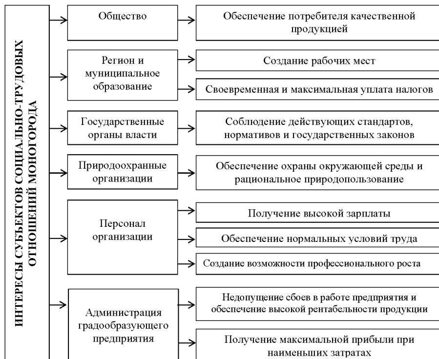
Рис. 1. Потребности заинтересованных сторон социально-трудовых отношений монопрофильного муниципального образования

Наличие рабочих мест, в свою очередь, обеспечивает гарантии экономической безопасности конкретных работников и членов их семей.