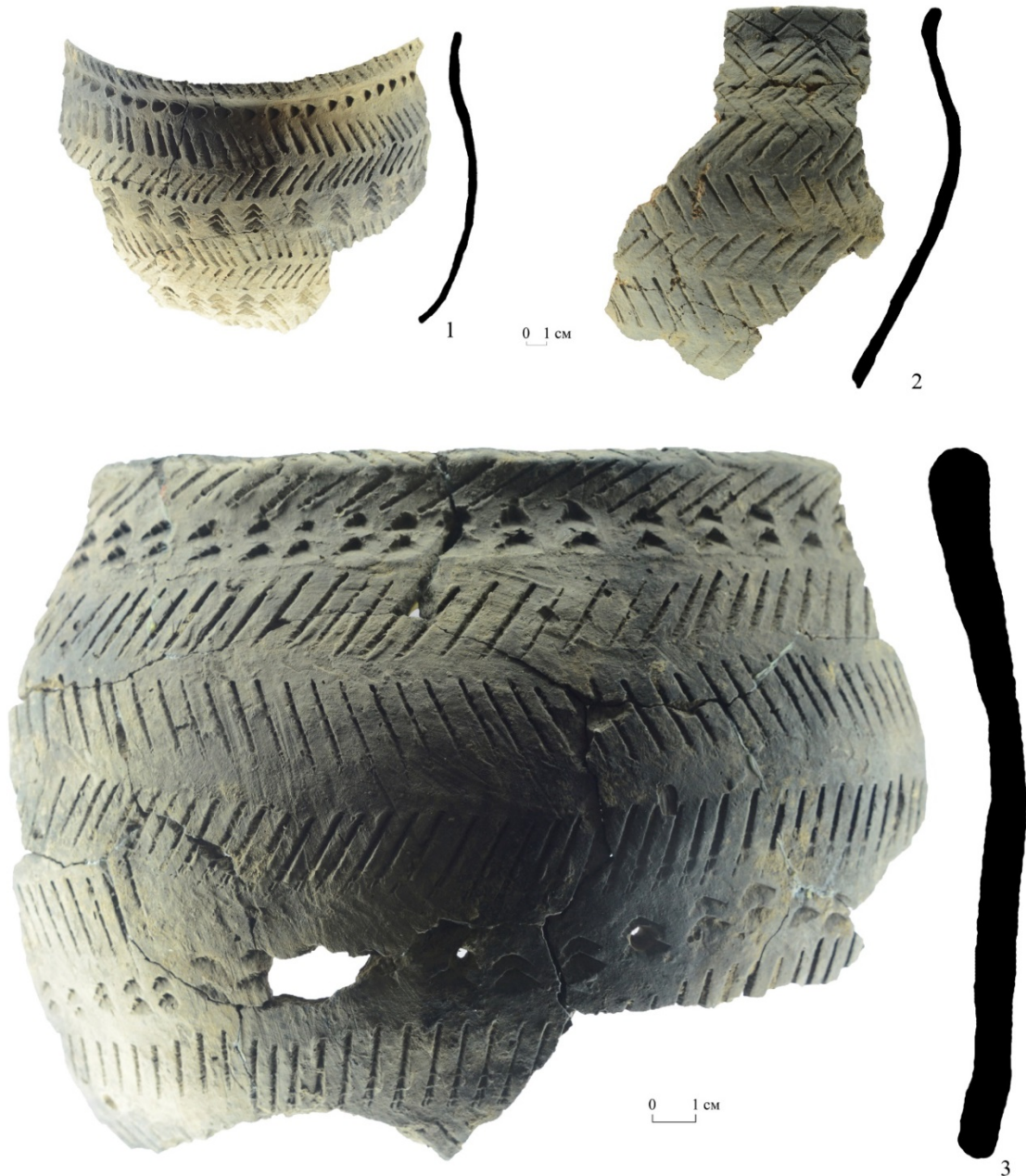
Рис. 3. Жилище «Тоянов городок». Керамические сосуды рядом с глинобитной печью в центре постройки. Раскоп 2018 г.

ной рядом с глинобитной печью в центре постройки, получена дата 130\pm 45 BP (образец Le-11844). Калибровка также дала широкий временной диапазон вплоть до современности ввиду загрязнения образца. Наиболее вероятная дата по корреляции двух сигм определяется 1682–1762 calAD для 22,8% вероятности ( 1\sigma ) и 1669–1781 calAD для 40% вероятности ( 2\sigma ). Дата укладывается в конец XVII – середину XVIII в.