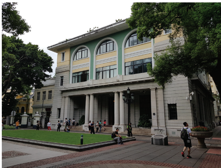
Рис. 7. Здание банка Yokogama Specie. Фото 2018 г.

Еще один японский банк – Yokogama Specie Bank – располагался напротив Гонконгско-Шанхайского банка в здании, в котором ранее находилось чешское консульство. Это сооружение, построенное в начале XX в., так же как и здание Mitsubishi Bank, представляет собой пример архитектуры эклектики (рис. 7). Северный и западный фасады трехэтажного объема имеют равноценное пластическое решение. Стены первого этажа и угловые части стен второго этажа облицованы декоративным серым камнем с использованием элементов классицизма и ренессанса в оформлении входов и пластической проработке стен. Решение уровня второго и третьего этажей тяготеет к стилистике модерна. Стены оштукатурены, окна объединены по вертикали широким архивольтом. В целом подобное решение в сочетании с сильно вынесенным карнизом придает сооружению визуальную легкость, особенно заметную на фоне монументальности здания HSBC.