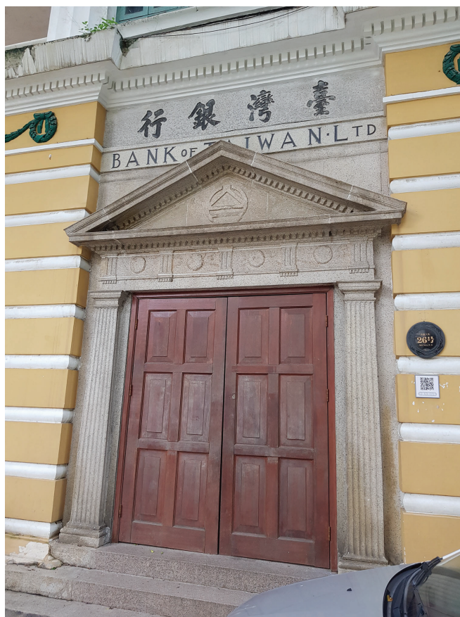
Рис. 5. Здание банка Тайваня, оформление главного входа. Фото 2018 г.

тую веранду. Первый этаж решен в виде рустованного цоколя. Главный вход акцентирован сандриком с треугольным фронтоном (рис. 5).