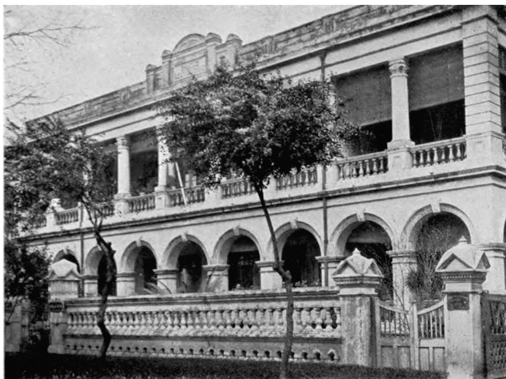
Рис. 10. Здание The Banque de L'Indo-Chine, первоначальный вид. Фото нач. XX в.

The Banque de L'Indo-Chine, известный также как Банк Индокитая, или Вьетнамский банк, со штаб-квартирой в Париже был основан в 1875 г. как коммерческий банк, целью которого являлось развитие французских колоний. Первое здание банка Индокитая на о. Шамянь появилось в 1890 г. на территории Французской концессии [8]. Сохранившаяся фотография начала XX в. дает представление о первоначальном облике этого сооружения (рис. 10).