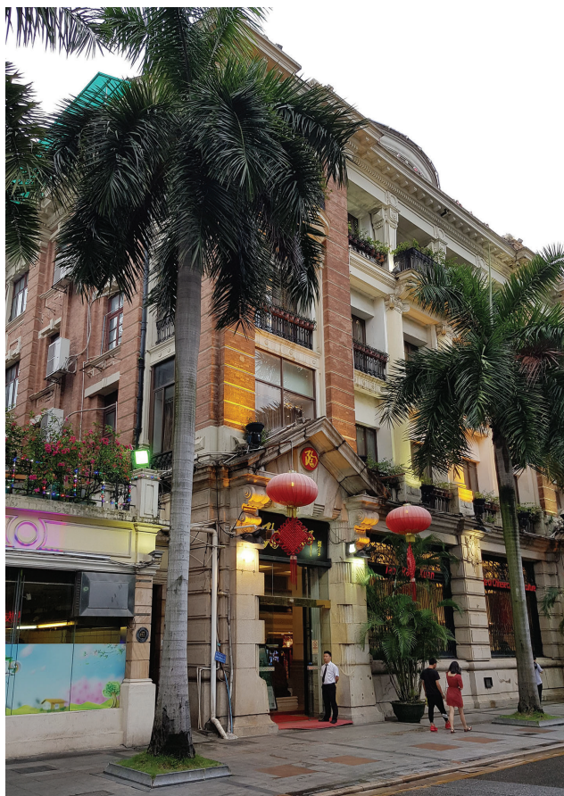
Рис. 8. Здание, принадлежавшее компании The E.D. Sassoon & Co., Ltd. Фото 2018 г.

На развитие архитектурного ансамбля о. Шамянь определенное влияние оказала деятельность торговых компаний, принадлежавших семье Sassoon, – The E.D. Sassoon & Co., Ltd. и D. Sassoon Sons Co., Ltd. Известно, что эти компании специализировались на продаже индийского хлопка и опиума, ввозимых в Кантон (ныне Гуанчжоу) из Бомбея (ныне Мумбаи), и имели на территории Британской концессии два собственных офисных здания, построенных в конце XIX в. [9]. Первое из них принадлежало The E.D. Sassoon & Co. Ltd. и находится в южной части острова на участке No. 1 Shamian Beijie (рис. 8). Здание представляет типичный пример архитектуры колониального стиля с характерным для него использованием ордерных колонн, объединяющих по вертикали несколько этажей и обрамляющих тем самым открытую веранду. По имеющимся данным, в нем длительное время размещался Немецко-Азиатский банк (Deutsche Asiathe Bank).