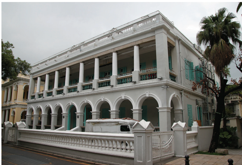
Рис. 11. Здание The Banque de L'Indo-Chine, современное состояние. Фото 2018 г.