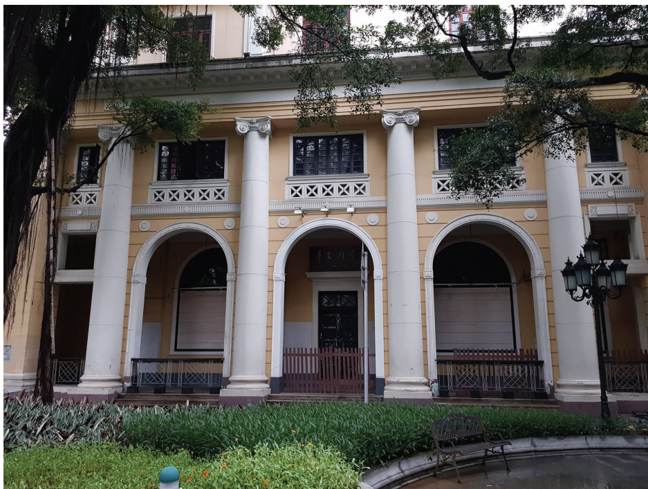
Рис. 4. Здание Международной банковской корпорации известное также как Сити банк (The City Bank), колоннада. Фото 2018 г.

Еще одним примером архитектуры неоклассицизма на территории Британской концессии является бывшее здание Международной банковской корпорации, известное также как Сити банк (The City Bank). Построено оно, по одним данным [8], по проекту известной в Нью-Йорке и Шанхае архитектурной фирмы Murphu & Dana, а по другим [9] – австралийского архитектора Артура Пурнелла. Сооружение состоит из двух объемов: основного здания и вспомогательного, объединенных переходом. Основной объем имеет два уличных фасада – восточный и южный, со стороны которого осуществляется главный вход в здание. Отличительной особенностью здания является массивная ионическая колоннада, объединяющая по вертикали первый и второй этажи (рис. 4). Диаметр колонн составляет 1,3 м, а высота – 8,42 м. По некоторым данным, эти колонны являются самыми высокими среди всех зданий, построенных на о. Шамянь. Еще одна особенность сооружения – скрипы Х-образной формы под окнами второго этажа. Эти элементы, используемые для увеличения воздухопроницаемости здания, получили достаточно широкое распространение в архитектуре Гуанчжоу из-за жаркого и влажного климата.