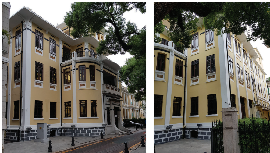
Рис. 12. Здание Китайско-Французского промышленного банка. Фото 2018 г.

Еще одним банковским учреждением на территории Французской концессии стал Китайско-Французский промышленный банк (China & France Industry Bank). Его сохранившееся здание расположено по адресу No. 22 Shamian Nanjie, по соседству с бывшим садом Французской концессии. Следует отметить, что эта организация являлась первым китайско-иностранным совместным банком. Его головной офис находился во Франции, в Париже, а отделение в Гуанчжоу было открыто в 1913 г. [9]. Сооружение представляет собой еще один пример архитектуры эклектики, однако от окружающей застройке его отличает достаточно сложный характер объемно-пространственной композиции.