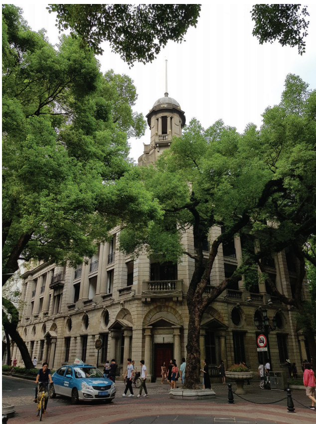
Рис. 2. Здание Гонконгско-Шанхайской банковской корпорации. Фото 2018 г.

катурены и лишены классического декора. Внешний облик сооружения с момента его строительства сохранился практически в первозданном виде, изменения претерпела внутренняя планировка, а по полу вестибюля первого этажа была сделана стяжка из прорезиненного бетона.