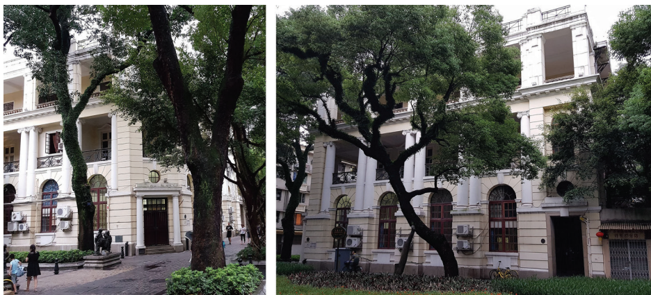
Рис. 3. Здание Чартерного банка Индии, Австралии и Китая. Фото 2018 г.

Fig. 2. Building of the Hong Kong-Shanghai Banking Corporation. Photo 2018