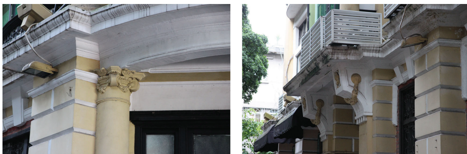
Рис. 9. Здание, принадлежавшее компании D. Sassoon Sons Co., Ltd., детали. Фото 2018 г.

ное решение. Первый этаж был выполнен в виде цоколя, а второй и третий этажи объединены по вертикале одинарными колоннами, на западном фасаде образующими открытую веранду. Угол здания скруглен, что придает объему большую плавность и выразительность.