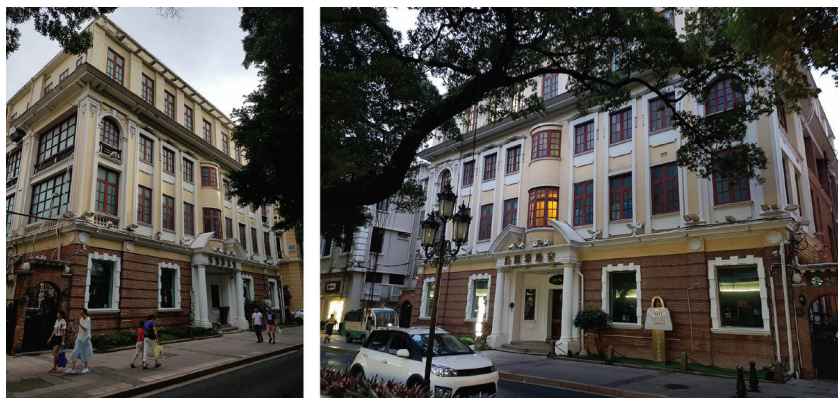
Рис. 6. Здание, принадлежавшее японской коммерческой корпорации Митсубиши (Mitsubishi Bank). Фото 2018 г.