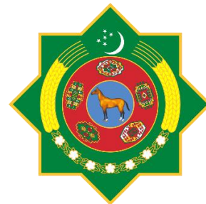
Рис. 10. Герб Республики Туркменистан (2003)

таких маркеров идентичности, как «идеализация национальной истории» и «апелляция к религиозным ценностям». В то же время такая форма щита нехарактерна для геральдики: звезда может использоваться только в качестве негеральдической фигуры или орнамента, т.е. элементов герба. Вышеперечисленные маркеры отражаются и в цветовой палитре, сочетающей в себе металл (золото) и финифть, представленную в виде зеленого (зелень), красного (червлень) и голубого (лазурь) оттенков. Зеленый цвет в данной коннотации показывает изобилие, считается символом исламских традиций. Красный оттенок обозначает храбрость, а голубой – великодушие, честность страны. Помимо этого, тюркское наследие находит свое воплощение в пяти ковровых гёлях (орнаменты), которые располагаются по часовой стрелке и символизируют родовые племена – ахалтеке, салыр, эрсары, човдур и йомут. В верхней части герба также можно заметить влияние «религиозных ценностей», поскольку здесь располагается полумесяц с пятью пятиконечными звездами. Наконец, важную роль при конструировании герба сыграл такой маркер, как «подчеркивание роли лидера», который нашел свое отражение в центральном элементе щита – негеральдической фигуре Янардага – коня первого лидера страны. Стоит отметить, что на предыдущих версиях герба в качестве основного элемента выступал не Янардаг, а Гырат – конь белой окраски, являющийся героем тюркского эпоса.