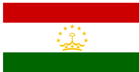
Рис. 7. Флаг Республики Таджикистан (1992)

Флаг государства был утвержден 24 ноября 1992 г. Он представлен в форме прямоугольного полотнища, состоящего из трех полос красного, белого и зеленого оттенков (рис. 7). Данная цветовая палитра отображает маркер «принадлежность к прошлому страны», преемственность советской вексиллологии, поскольку флаг Таджикской ССР имел аналогичные современному символу цвета. Можно говорить и о традиции следования паниранской палитре, поскольку идентичная цветовая гамма присутствует на флагах Ирана и Курдистана [32]. Такая расцветка напоминает, что древнеиранское общество, согласно священному тексту Авесты, стратифицировалось на три сословия, и каждое из них ассоциировалось с определенным цветом: красный – военные, белый – духовенство, зеленый – земледельцы. В центре флага, согласно маркеру «религиозные ценности», изображена корона с полукругом из семи пятиконечных звезд над ней, аналогичная фигуре на гербе Таджикистана.