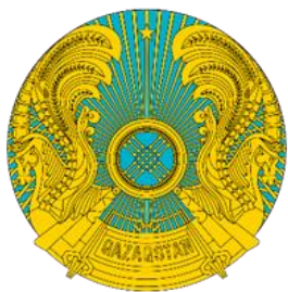
Рис. 1. Герб Республики Казахстан (1992)

Современный герб Республики Казахстан был утвержден Указом Президента 4 июня 1992 г. (рис. 1). Авторами символа стали Ж. Малибеков и Ш. Уалиханов. Герб апеллировал к истории тюркоязычных народов, к идеям автохтонного происхождения казахов, «золотого века кочевников». Он был представлен в форме восточного (круглого) геральдического щита, что соответствует традициям территорий Малой Азии, Среднего Востока, Дальнего Востока, Центральной Азии. Тинктура герба была выбрана неслучайно: сочетание металла (золота) и финифти сине-голубого цвета (согласно геральдическому языку – лазурь) с древних времен почиталось у тюркских народов. Золотой оттенок выступал символом знатности и богатства, а голубая палитра ассоциировалась с бескрайним небом, реками и озерами, указывала на кочевой образ жизни. Наконец, центральной фигурой геральдического щита было выбрано изображение шанырака – одного из основных символов тенгрианства – верований тюрко-монгольских кочевников. Шанырак представляет собой верхнюю сводчатую часть юрты, от которой в виде солнечных лучей во все стороны расходятся уйки (опоры). Для казахов данный элемент является символом семейного очага, своеобразной реликвией. В качестве обрамления герба выступают легендарные фигуры – мифические кони (тулпары) – из традиционной тюркской мифологии. Образ лошади в данном случае неразрывно связан с казахским воином-батыром, который вел кочевой образ жизни.