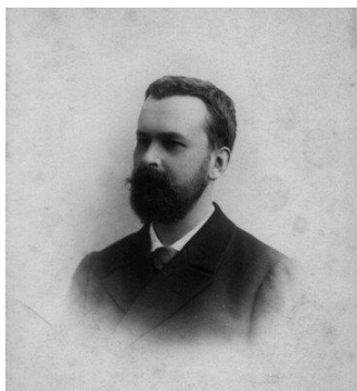
Рис. 1. Князь Евгений Николаевич Трубецкой (1863–1920)

На рисунке мы видим три фигуры князя Е.Н. Трубецкого с непропорционально большой головой (этот прием часто использовали карикатуристы) на фоне людей, которые значительно меньше главного героя, что придает ему значимость и обращает особое внимание зрителей. Автор иронизирует над князем, опубликовавшим в «Русских ведомостях» открытое письмо о проекте университетского устава, а именно над преувеличением собственных заслуг в защите университетской автономии. Что является в рисунке исторической достоверностью, а что мифом, попробуем выяснить, рассмотрим деятельность Е.Н. Трубецкого в решении пресловутого университетского вопроса на фоне социально-политических преобразований в России начала XX в.