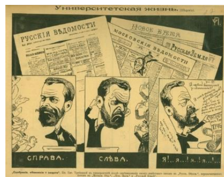
Рис. 2. Карикатура на Е.Н. Трубецкого [Там же]

По своему образованию Е.Н. Трубецкой был юристом. Он окончил в 1885 г. Императорский Московский университет со степенью кандидата права, после чего преподавал юридические дисциплины в Демидовском юридическом лицее (Ярославль) в 1886–1892 гг., в Киевском (1892–1906) и Московском университетах (1906–1910). Кроме правоведения его интересовали вопросы религиозной философии и богословия. Он связал принципы христианства с правовой культурой, которая сложилась в различных церковных традициях. Анализу религиозно-философских воззрений Западной Европы были посвящены его диссертации: в 1892 г. он защитил магистерскую диссертацию [9], а в 1897 г. – докторскую [10].