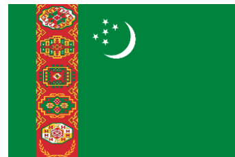
Рис. 11. Флаг Республики Туркменистан (2003)

Флаг Туркменистана также был утвержден 19 февраля 1992 г. и претерпел изменения в 1997 г. (рис. 11).