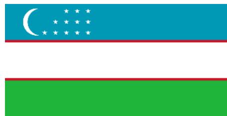
Рис. 13. Флаг Республики Узбекистан (1991)

Современный флаг Республики Узбекистан был утвержден 18 ноября 1991 г. в виде прямоугольного полотнища, состоящего из трех горизонтальных полос голубого, белого и зеленого оттенков (рис. 13). Голубой оттенок, представленный на флаге, показывает небо, воду, белый цвет выступает как символ мира, зеленый обозначает благоприятную окружающую среду страны. «Религиозные ценности» как маркер идентичности находят свое отражение в изображении в левой части полотнища у древка флага в качестве основной фигуры белого полумесяца с двенадцатью пятиконечными звездами. Полумесяц показывает религиозные традиции Узбекистана, а двенадцать звезд соответствуют месяцам, областям страны.