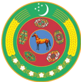
Рис. 9. Герб Республики Туркменистан (2000–2003)

Однако позднее символ был представлен в качестве восьмигранника – Руб аль-хизба – мусульманского знака, который изображается в виде двух наложенных квадратов и образует восьмиконечную звезду (рис. 10). Данная октаграмма в Туркменистане носит название «звезда Огузхана» – древнего героя туркмен (прародителя), что одновременно показывает и тюркские, и исламские традиции народа и говорит о формировании