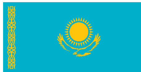
Рис. 2. Флаг Республики Казахстан (1992)

Таким образом, герб и флаг Республики Казахстан отражают тюркское наследие, историю кочевых народов. Форма геральдического щита, тинктура, ключевые фигуры, изображенные на символах, показывают, что в качестве основного маркера идентичности выступает «идеализация национальной истории», транслирующая идею о «золотом веке» казахов. Частично используется идентификатор «обращение к традиционной культуре и мифологии» (на гербе – негеральдические фигуры – тулпары). Провозглашенный в начале независимости государства курс на конструирование многосоставной (евразийской) идентичности не нашел своего четкого отражения в официальных символах. Можно говорить о том, что в Казахстане был сделан акцент на этнической (тюркской) идентичности.