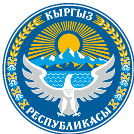
Рис. 3. Герб Киргизской Республики (2016)

Стоит отметить, что герб 1994 г. имел много геральдических ошибок (визуальная графика, расстояние между буквами, нестыковки и т.д.), да и в принципе не был сведен к единым стандартам. Тем не менее