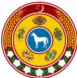
Рис. 8. Герб Республики Туркменистан (1992–2000)

В отличие от других стран региона, Туркменистан после распада СССР сохранил в основе своего устройства традиционный тип общества, в котором социокультурное пространство представляет собой совокупность различных племен. При этом наблюдалась определенная разобщенность как между этническими кланами, так и внутри их самих. Из-за этого в научном дискурсе даже утвердилась концепция, согласно которой туркмены до сих пор являются «нацией племен», а не единой нацией в традиционном понимании данного термина [33]. В попытке консолидации общества и легитимизации собственной власти первый президент страны С.А. Ниязов был вынужден персонифицировать политический режим («культ личности Туркменбаши»), а также фактически ограничить функционирование институциональных механизмов в государстве. Государственный герб Туркменистана с момента обретения независимости поменялся три раза. С 1992 по 2003 г. герб государства имел восточную (круглую) форму щита (рис. 8, 9).