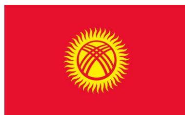
Рис. 4. Флаг Киргизской Республики (1992)

Вопрос о принятии нового флага Киргизской Республики в 1990-е гг. вызвал немало дискуссий при выборе основной палитры символа: так, депутаты с либеральными взглядами поддерживали проект с использованием голубого полотнища, а другие члены Верховного Совета страны, настроенные коммунистически, требовали использовать красный цвет. Окончательный вариант, утвержденный 3 марта 1992 г., был представлен в форме прямоугольного красного полотнища, что, с одной стороны говорит о влиянии эпоса «Манас», поскольку знамя главного героя было такого же оттенка. С другой стороны, такую палитру можно трактовать с точки зрения влияния советского наследия, где эта расцветка была основной в вексиллологии (рис. 4). Кроме красного оттенка, обозначающего доблесть и смелость, на флаге используется золотой цвет, олицетворяющий покой и богатство. Маркер «идеализации национальной истории» в виде тюркского наследия находит свое отражение в изображении солнечного диска с лучами, объединенными в круг и символизирующими синтез древних племен Киргизии. Внутри диска прорисован тундук красного цвета, что соответствует тенгрианским традициям и имеет схожесть с национальным гербом Республики Казахстан.