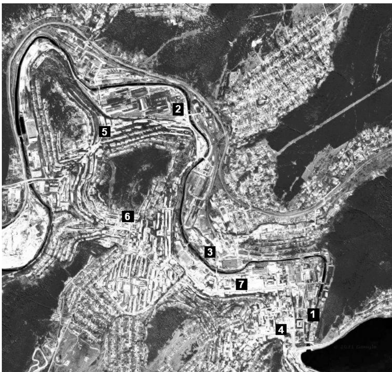
Рис. 1. Схема городского пространства Златоуста 1920–1940-х гг.: 1 – Инструментальный завод; 2 – Металлургический завод; 3 – Керамический (абразивный) завод; 4 – старый центр (ул. Ленина); 5 – поселок металлургического завода; 6 – седловина горы Татарки; 7 – новый центр (ул. Карла Маркса)

Вновь обретаемый Златоустом статус индустриального гиганта поддерживался интенсивным строительством, которое развернулось в центральной части города. Златоуст обзаводился крупными зданиями, выдержанными в конструктивистской стилистике и, безусловно, игравшими презентационную роль.