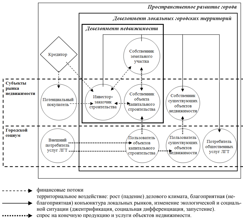
Рис. 3. Схема субъектного состава и типов взаимодействия в ходе развития городских территорий

Интерес инвестора заключается в извлечении прибыли, интерес социума ЛГТ – в повышении комфортности проживания, в ответственном использовании локальных ресурсов. Преобразование с недвижимостью в границах ЛГТ должны рассматриваться не как инвестиционный проект развития единичного земельного участка, а как проект девелопмента ЛГТ, когда достигается удобство для всех жителей ЛГТ, а не только для строительных компаний, которые часто после завершения строительства, потеряв коммерческий интерес, покидают ЛГТ, и новых собственников недвижимости, которые стремятся овладеть ограниченными ресурсами ЛГТ в ущерб остальным жителям.