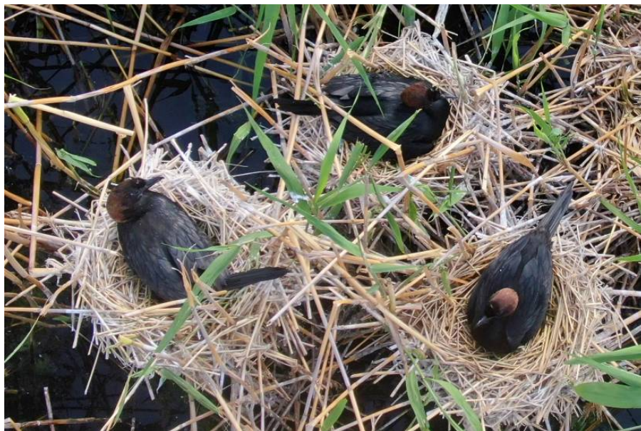
Рис. 3. Малые бакланы на гнёздах, оз. Мал. Донки, 18 июня 2025 г. [ Fig. 3. Pygmy Cormorants on nests, Lake Malye Donki, 18 June 2025]