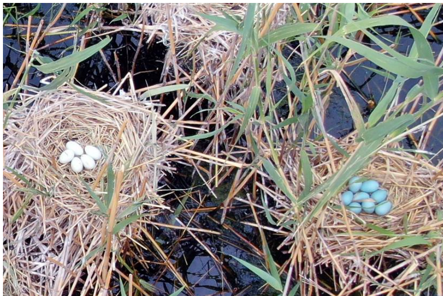
Рис. 5. Кладки малого баклана (слева) и каравайки (справа) на оз. Мал. Донки, 19 июня 2025 г. [ Fig. 5. Egg clutches of Pygmy Cormorant (left) and Glossy Ibis (right) on Lake Malye Donki, 19 June 2025]