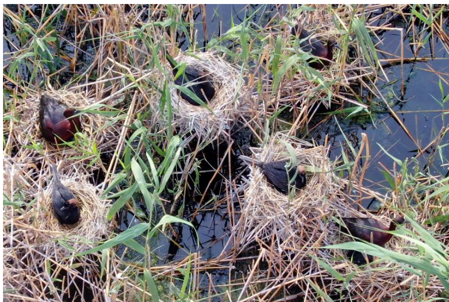
Рис. 1. Гнёзда малых бакланов и караваек на оз. Мал. Донки, 18 июня 2025 г. [Fig. 1. Nests of Pygmy Cormorants and Glossy Ibises on Lake Malye Donki, 18 June 2025]