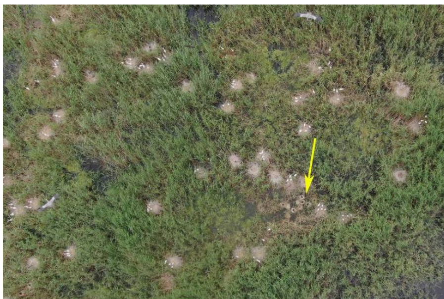
Рис. 2. Расположение поселения малых бакланов и караваек (показано стрелкой) среди гнёзд больших белых и серых цапель на оз. Мал. Донки, 19 июня 2025 г. [Fig. 2. The location of the settlement of Pygmy Cormorants and Glossy Ibises (shown by the arrow) among the nests of herons on Lake Malye Donki, 19 June 2025]