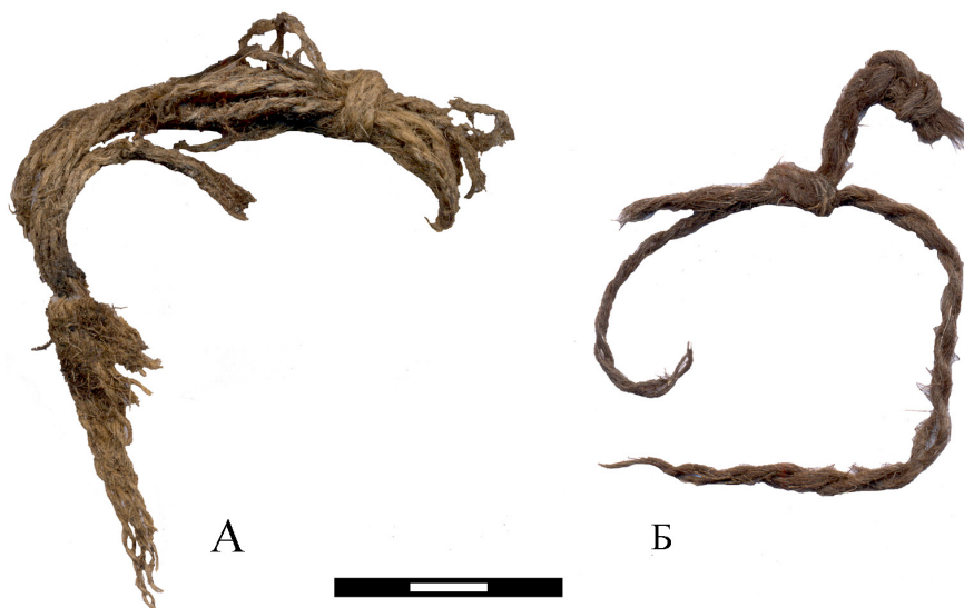
Рис. 2. Фрагменты свивальников: А – погребение 1; Б – погребение 2