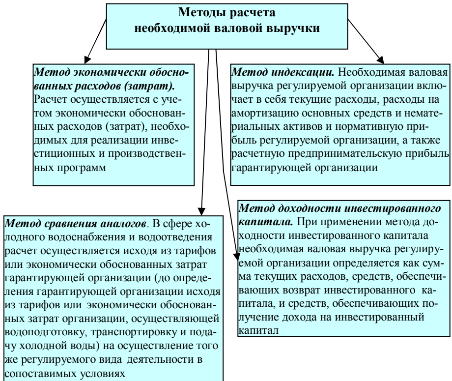
Рис. 1. Методы расчета необходимой валовой выручки в сфере водоснабжения и водоотведения (Рисунок составлен авторами)

В энергетическом секторе экономики переход на RAB-регулирование было обязательным. 31 декабря 2017 г. у большинства теплоснабжающих организаций закончился первый период долгосрочного регулирования вышеназванным методом. Однако уже сегодня просматривается тенденция неисполнения тех целевых показателей, которых требовалось достичь при переходе на такое регулирование.