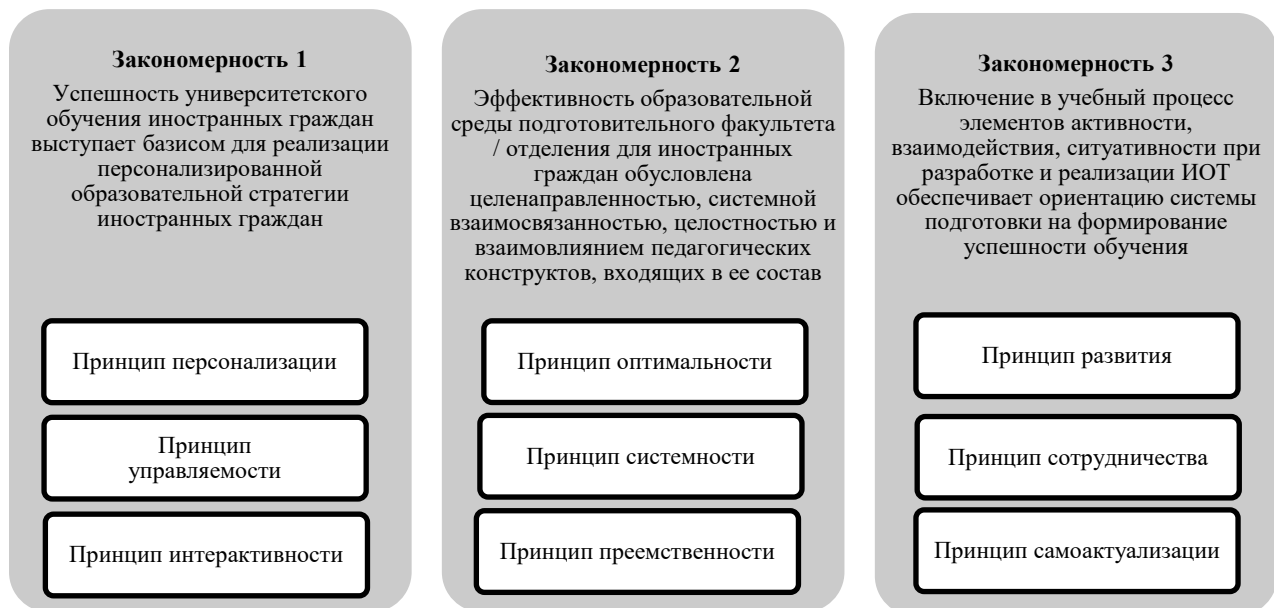
Рис. 3. Закономерности и принципы Концепции успешности университетского обучения иностранных граждан

Закономерности и принципы Концепции. Актуальные педагогические закономерности и принципы, отражающие педагогические реалии университетского обучения иностранных граждан и лежащие в основе теоретико-методологического раздела Концепции, схематично представлены на рис. 3.