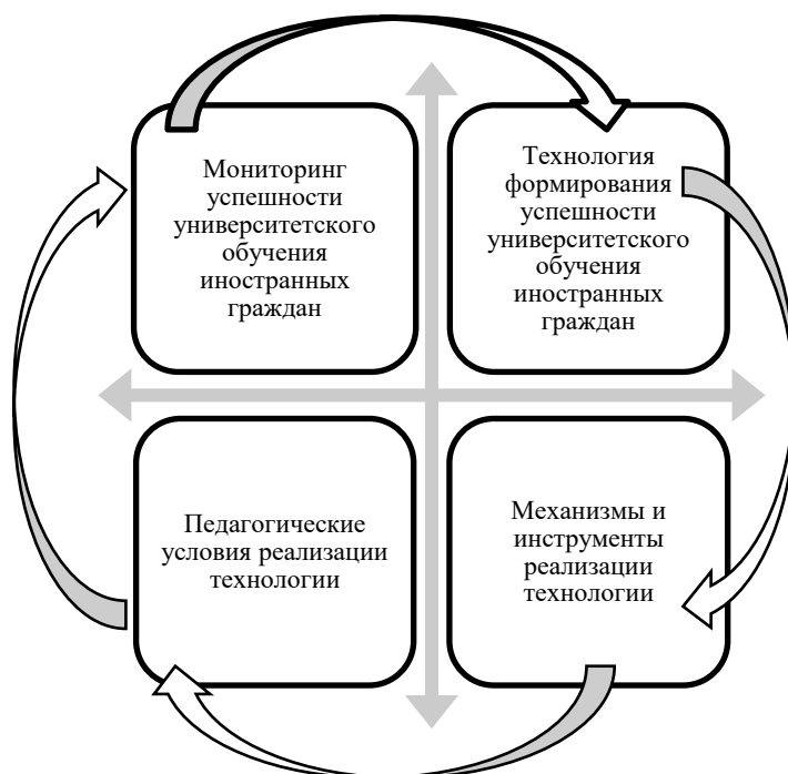
Рис. 4. Компоненты практико-технологического раздела Концепции

Практико-технологическая часть Концепции представлена четырьмя методико-технологическими компонентами, необходимыми для ее реализации (рис. 4).